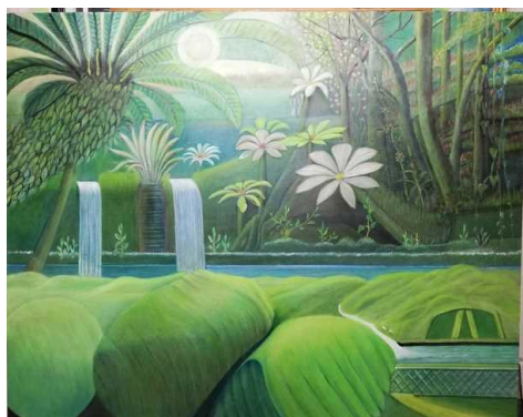
(藤木先生の絵です)