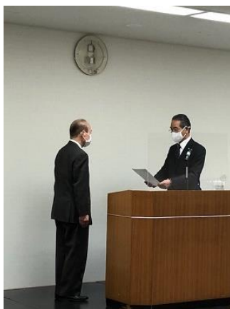
「東明未来塾第六期本部コース修了の日を迎えて」